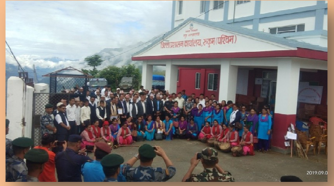
निजामति सेवा दिवस २०७६