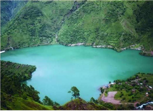
स्यारु ताल बाँफिकोट रुकुम (पश्चिम)