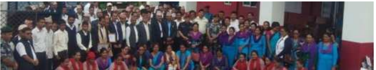
निजामति सेवा दिवस २०७६