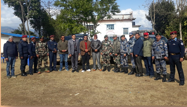
अन्तर जिल्ला समन्वय बैठक (रुकुम पश्चिम, जाजरकोट, सल्यान)