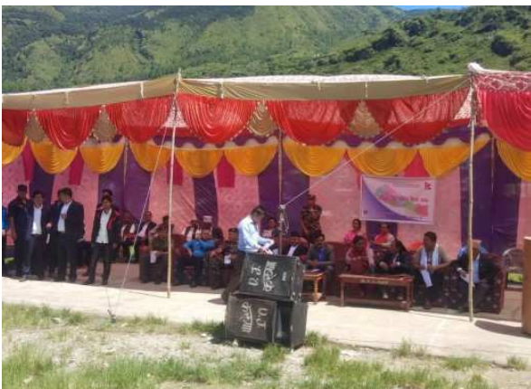
संविधान दिवस तथा राष्ट्रिय दिवस २०७६