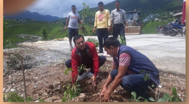
कार्यालय परिसरमा वृक्षारोपन गर्दै (मिति २०७६-०४-१७)