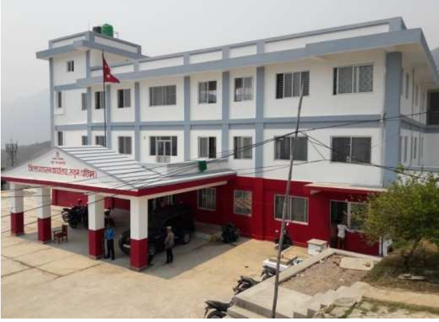
जिल्ला प्रशासन कार्यालय रुकुम (पश्चिम)को भवन