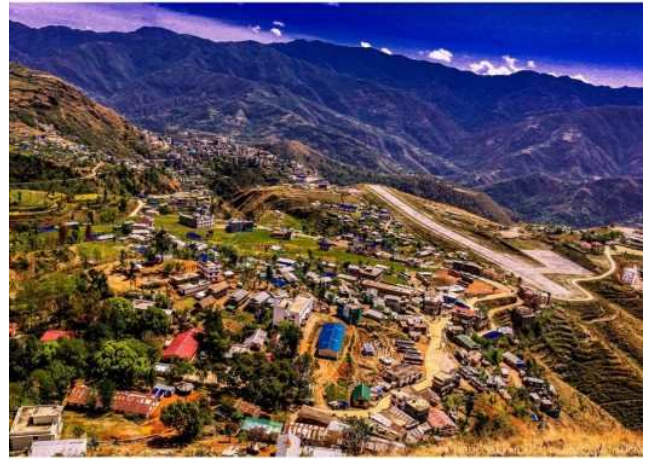
रुकुम (पश्चिम) जिल्लाको सदरमुकाम मुसिकोट खलंगा