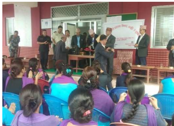
निजामति सेवा दिवस २०७६