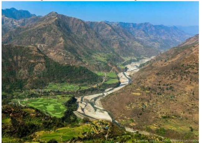
सानिभेरी नदी रुकुम (पश्चिम)