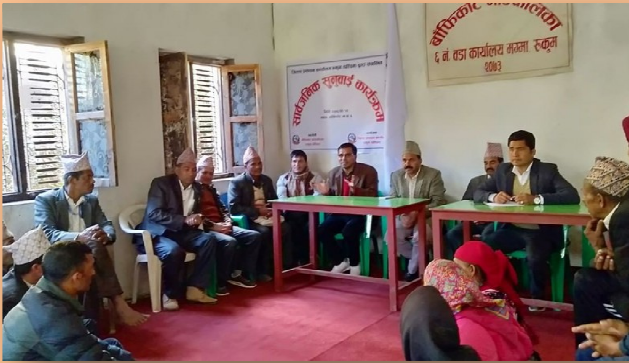
सार्वजनिक सुनुवाइ तथा घुम्ति शिविर बाँफिकोट