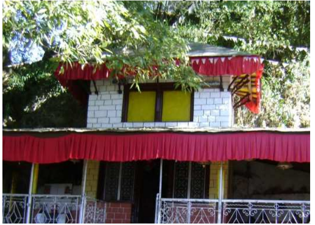
शाईकुमार भगवति मन्दिर डिप्रे रुकुम (पश्चिम)