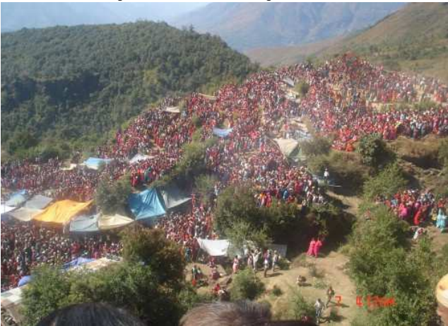
डिप्रे मन्दिर रुकुम (पश्चिम) मा कार्तिक पुर्णिमामा लाग्ने मेला