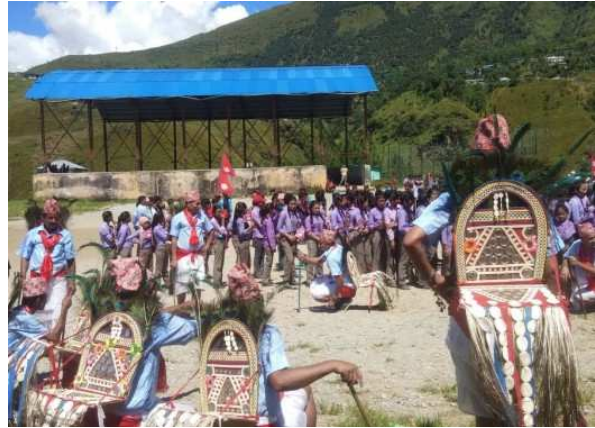
संविधान दिवस तथा राष्ट्रिय दिवस २०७६